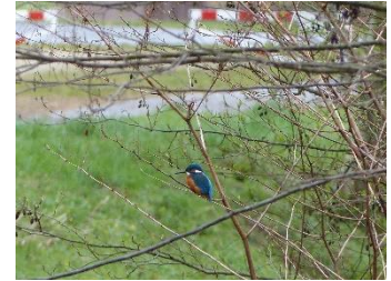
Foto Eisvogel

Sehr schön ist zu dieser Zeit auch zu beobachten, wie die Schwalben in rasantem Flug über der Wasseroberfläche nach Insekten jagen. Und wenn Sie großes Glück haben, sehen Sie den Eisvogel in blitzschnellem Flug in geringer Höhe über dem Wasser. Wem das zu hektisch ist, der kann an Bahn 13 den Schildkröten beim Sonnenbaden zusehen –falls die scheint.