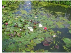
Foto Seerosen