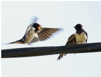
Rauchschwalben

Unbeeindruckt von allen Aktivitäten auf dem Wasser steht der Graureiher am Uferand und wartet regungslos auf Beute. Meist gut zu sehen, wenn man das Grün der Bahn 6 verlässt und gegenüber zum Rand der Bahn 8 schaut.