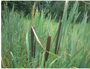
Foto Rohrkolben

Genießen Sie sodann für einen Augenblick das frontale Wasserhindernis an Bahn 17 als sei es ein Gemälde französischer Impressionisten. Schilfrohr, Rohrkolben, weiße und rosa Seerosen, Froschlöffel, Igelkolben, Wasserminze vereinen sich zu einem kleinen, grünbunten Paradies in dem Vierfleck Libelle, Blauflügel Prachtlibelle, Frühe Adonis Libelle umherschwirren, die Küken vom Teichhuhn über die Seerosenblätter stolzieren und Froschlurche mit großem Satz ins Wasser springen. Mit dieser Inspiration gelingen Ihnen der folgende Chip und Put ganz bestimmt.