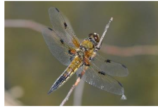
Foto Vierfleck Libelle